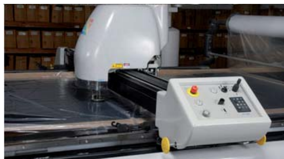
Dimensionnement, découpe et assemblage irréprochable