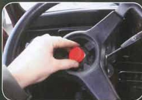
Puis ôter le cabochon d'écrou.