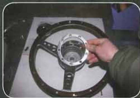
Pose du volant sur le moyeu et mise en place du cerclage