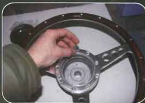
Mise en place des boulons