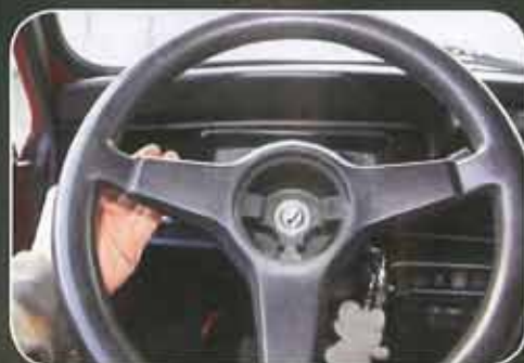
Mettre vos roues et le volant droit. Puis tapoter à la main le volant pour l'enlever.