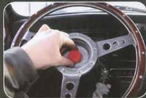
Reposer le cache.