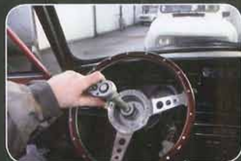
Approcher puis serrer au couple à 4,8 m.kg.