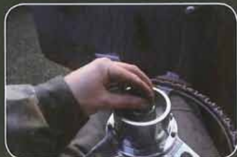
Mise en place des goupilles fendues