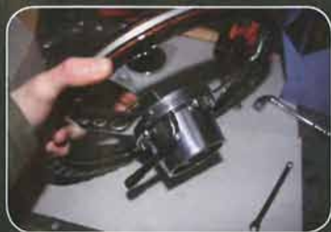
Puis serrage, en croix de préférence