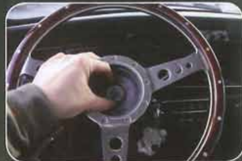
Pose du volant et de l'écrou