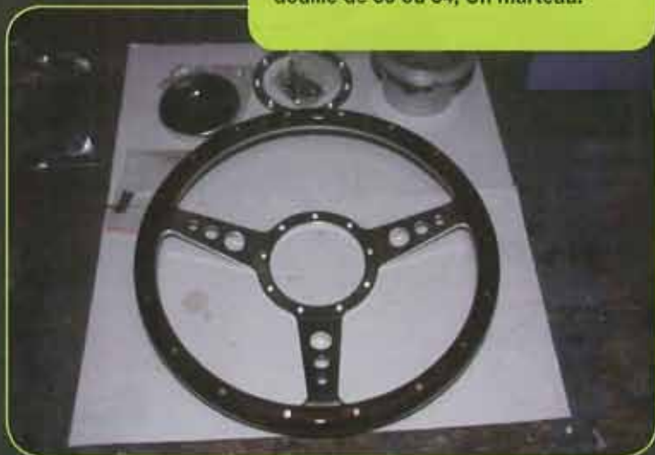
Le volant avec son moyeu

Matériel Clef plate de 8, Clef à laïone de 3, 1 tournevis plat, Une douille de 30 ou 34, Un marteau.