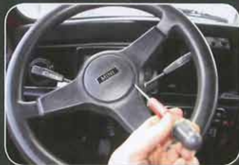
Enlever le cache.