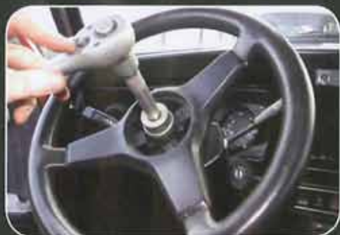
Desserrer l'écrou en tenant fermement le volant.